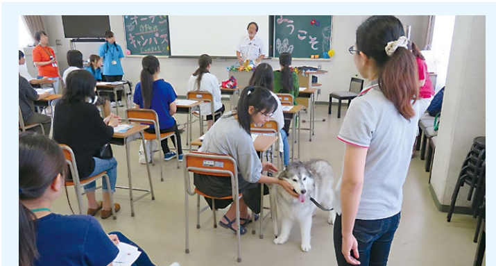
2018年度 オープンキャンパスの様子